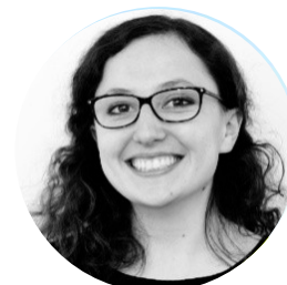
Louise ROUSSEAU Titulaire Ministère de l'Europe et des Affaires Etrangères