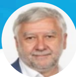
Ronan DANTEC Suppléant Sénateur de Loire-Atlantique