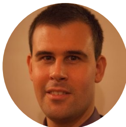
Lionel LAUNOIS Suppléant Ministère de la transition écologique